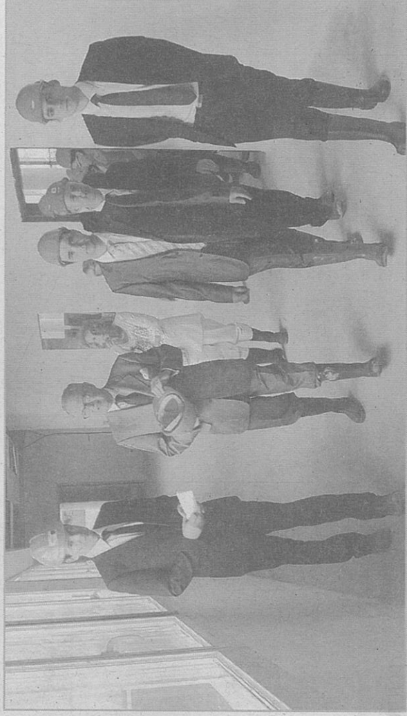
La visite a permis de mesurer les nouveautés apportées par l'établissement aux futurs patients.

Après six mois de travaux pour la réhabilitation d'une partie du centre hospitalier existant qui accueillera un hôpital de jour et la chirurgie ambulatoire. Avant de pénétrer à l'intérieur, sa façade en béton lustrée rappelant le grès des Vosges a été remarquée. Dans les couloirs du nouveau bâtiment, les visiteurs ont été guidés dans les différents services qui prendront place prochainement. Après avoir découvert la salle de restauration du personnel au rez-de-chaussée, les participants ont pris la mesure de la métamorphose qui va s'opérer. Plusieurs